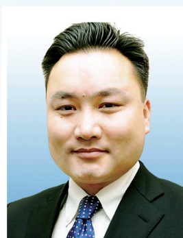
Монголын олон улсын ба үндэсний арбитрын арбитрч Б.БАТХУЯГ