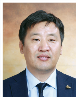
Макс группийн Ерөнхийлөгч Д.ГАНБААТАР