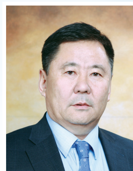
Нью Жуулчин Турс ХХК-ний Ерөнхий захирал Ш.НЭРГҮЙ