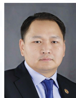
UFC группийн Ерөнхий захирал О.АМАРТҮВШИН